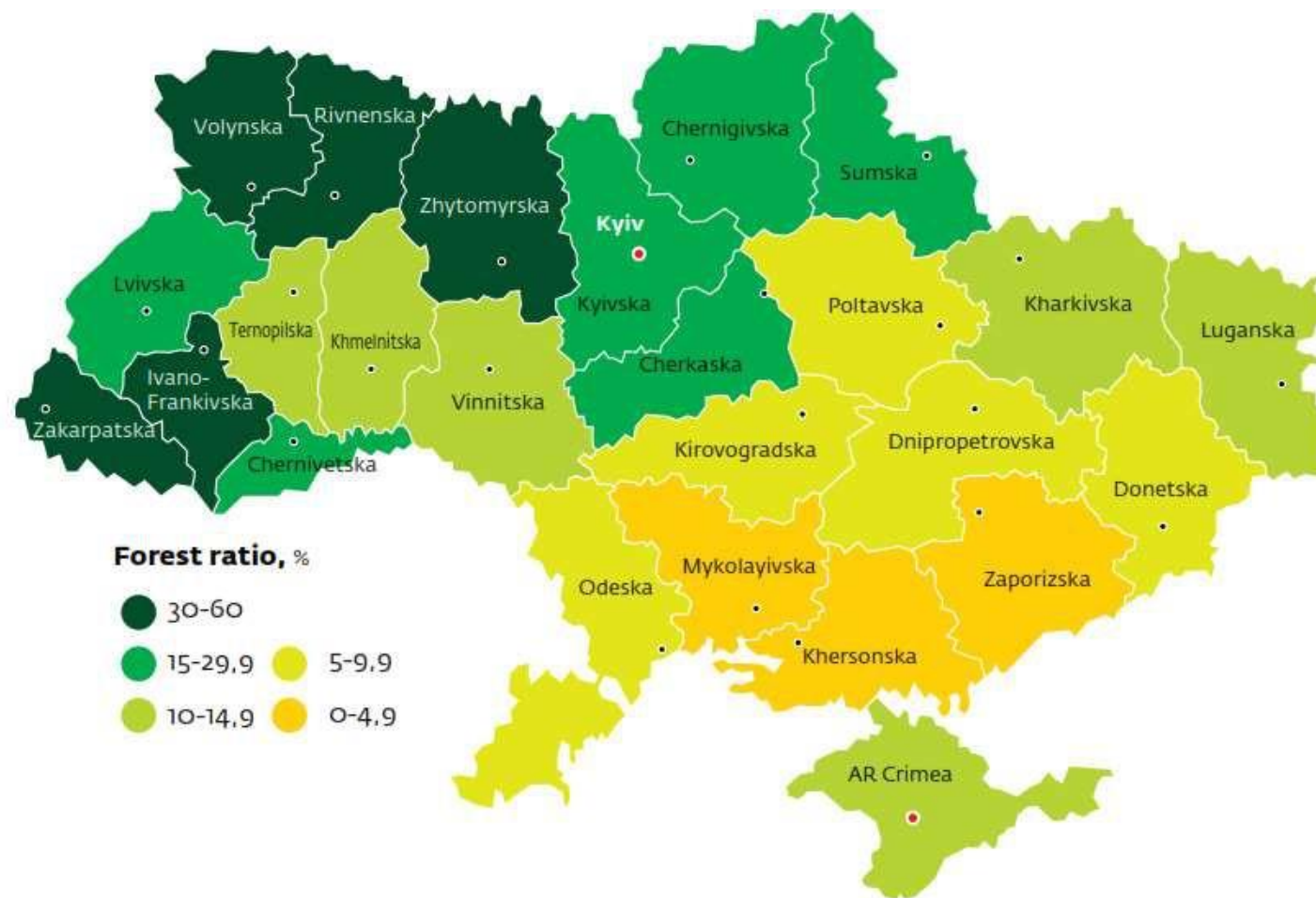
Рисунок 2: Лісистість України (Довоєнна ситуація)