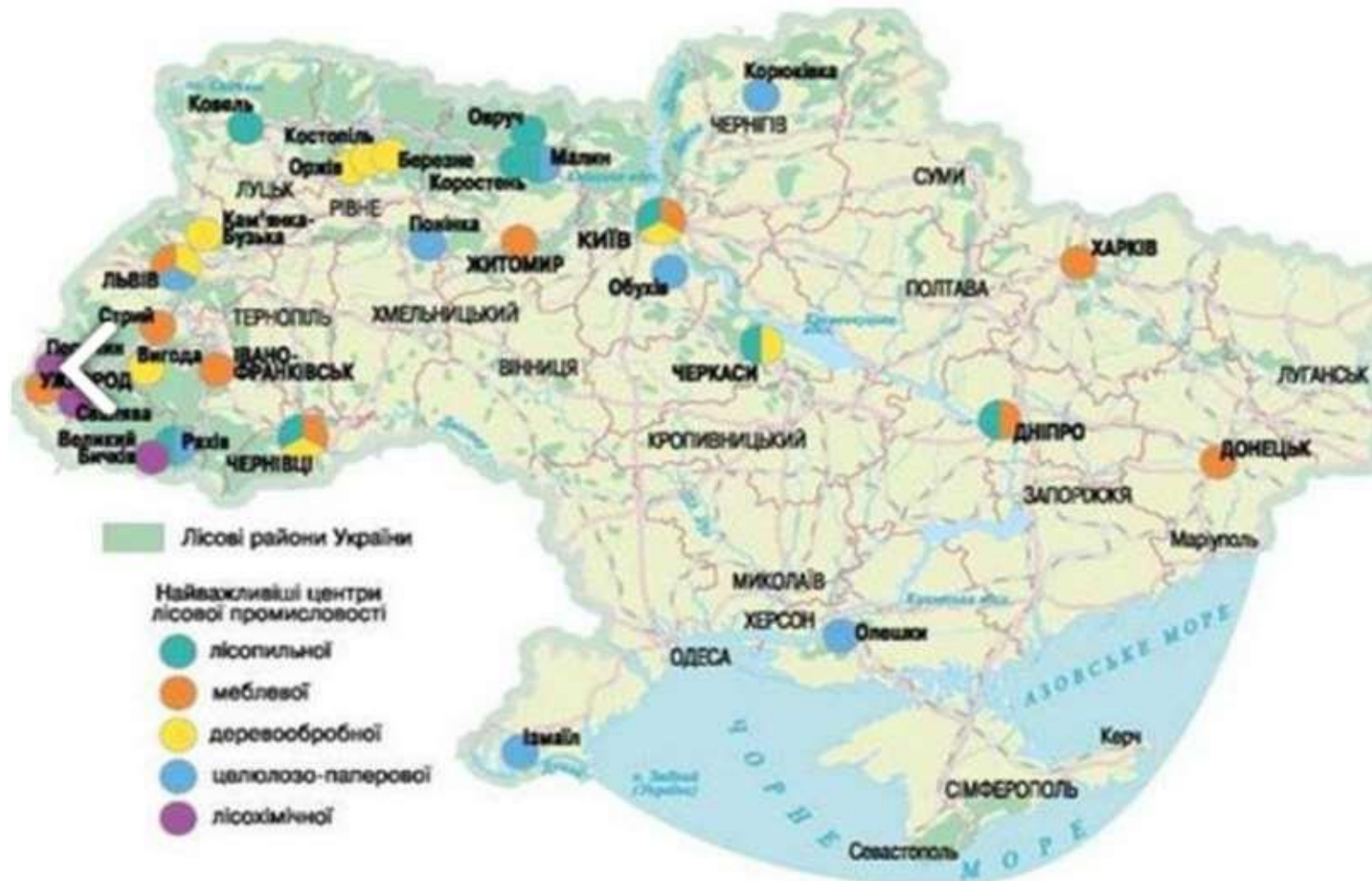
Рисунок 4: Найважливіші центри лісової промисловості в Україні